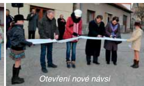
Otevření nové návsi