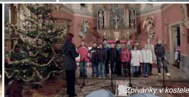
Zpívánky v kostele

Základní škola a Mateřská škola Ovčáry zve všechny předškoláky na