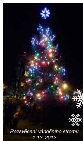
Rozsvěcení vánočního stromu 1. 12. 2012

FC Ovčáry – výbor oddílu kopané přeje všem svým hráčům, příznivcům a přátelům ovčárecké kopané příjemné prožití vánočních svátků a hodně zdraví, štěstí a pohody do nového roku. Zároveň všechny zve na tradiční „ Silvestrovský fotbalák “, který se uskuteční na hřišti na Horce od 13.00 hod.