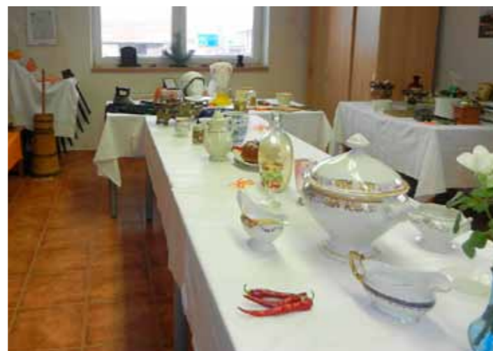
Foto z výstavy Z BABIČČINY ALMÁRKY, kterou pořádá Český červený kříž 3.- 4.11. 2012

jídelního příboru dbejte na správné ukládání.