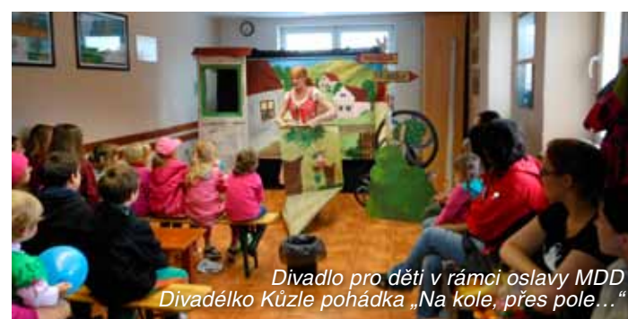
Divadlo pro děti v rámci oslavy MDD Divadelko Kůzle pohádka „Na kole, přes pole...“