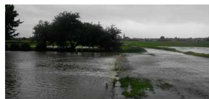
povodeň zasáhla i Nádržku